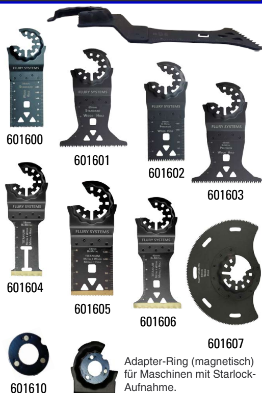
Adapter-Ring (magnetisch) für Maschinen mit Starlock-Aufnahme.